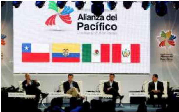
Los presidentes de los países fundadores, ayer durante la Cumbre.

En un comunicado de cuatro puntos emitido anoche, apenas confirmada la aprobación de la adhesión de nuestro país como miembro observador en la Alianza del Pacífico, el Ministerio de Relaciones Exteriores señala que los gobiernos de México, Colombia, Chile y Perú han otorgado al Paraguay la calidad de observador, a fin de participar en esta iniciativa “que pretende orientar una nueva dimensión en la integración latinoamericana y con la cual Paraguay comparte valores, principios y visiones comunes”. “El Paraguay considera que las oportunidades que esta iniciativa puede brindar son inmensas, y reflejan una adecuada percepción de la realidad hacia renovadas dimensiones de cooperación y colaboración entre los pueblos del continente”, indica el escrito. “Al mismo tiempo –prosigue–, constituye la proyección hacia una vinculación más intensa con una región como el Asia Pacífico, que ha simbolizado el dinamismo en el proceso global en los últimos años y que junto con Europa constituyen los principales socios comerciales y de cooperación del Paraguay”, resalta además la Cancillería. Finalmente, expresa un “reconocido agradecimiento a los gobiernos de México, Colombia, Chile y Perú, por la confianza y el apoyo recibido en la concreción de esta incorporación”.